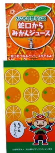
⑫みかんジュース蛇口イメージ

意見交換会場内に、県産品（地酒や開催時期に旬を迎える柑橘、銘菓等）を配置し、Presented by ○○と看板に表示します。 その横に机1つを配置しますので、そちらに展示などをいただきながら、県産品を味わう参加者のみなさまに随時お声がけをいただけます。 ※配布する県産品に関する費用は含まれています。 ※県産品、みかんジュース蛇口等の手配は事務局にて行います。