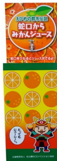
◀ ⑫みかんジュース蛇口イメージ

蛇口横に机1つを配置しますので、そちらに展示などをいただきながら、 蛇口を利用する参加者のみなさまに随時お声がけをいただけます。