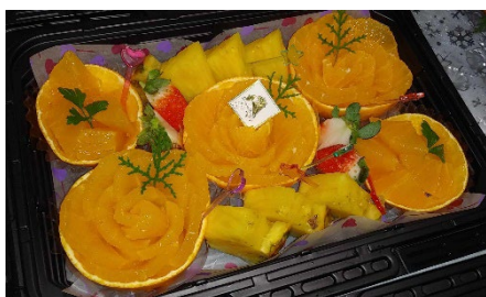
◀ ⑪のイメージ (いずれも予定) ▶

その横に机1つを配置しますので、そちらに展示などをいただきながら、 県産品を味わう参加者のみなさまに随時お声がけをいただけます。